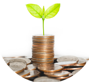
Levée de fonds (dette et equity)