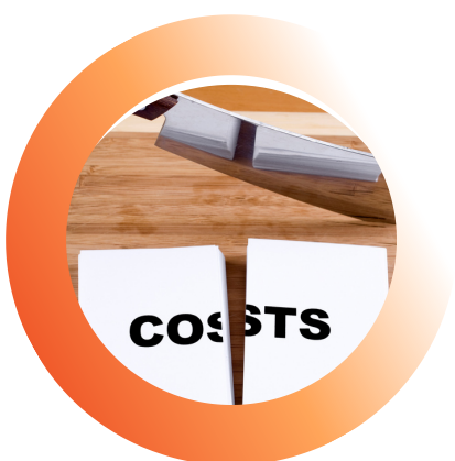
Cost Killing (réduction des coûts)