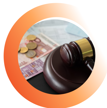
Ingénierie financière, juridique et fiscale